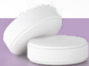
СХЕМА НАЗНАЧЕНИЯ АВИАНДРА

*По действующему веществу. URL: https://grls.rosminzdrav.ru/GRLS.aspx на 23.10.2023.